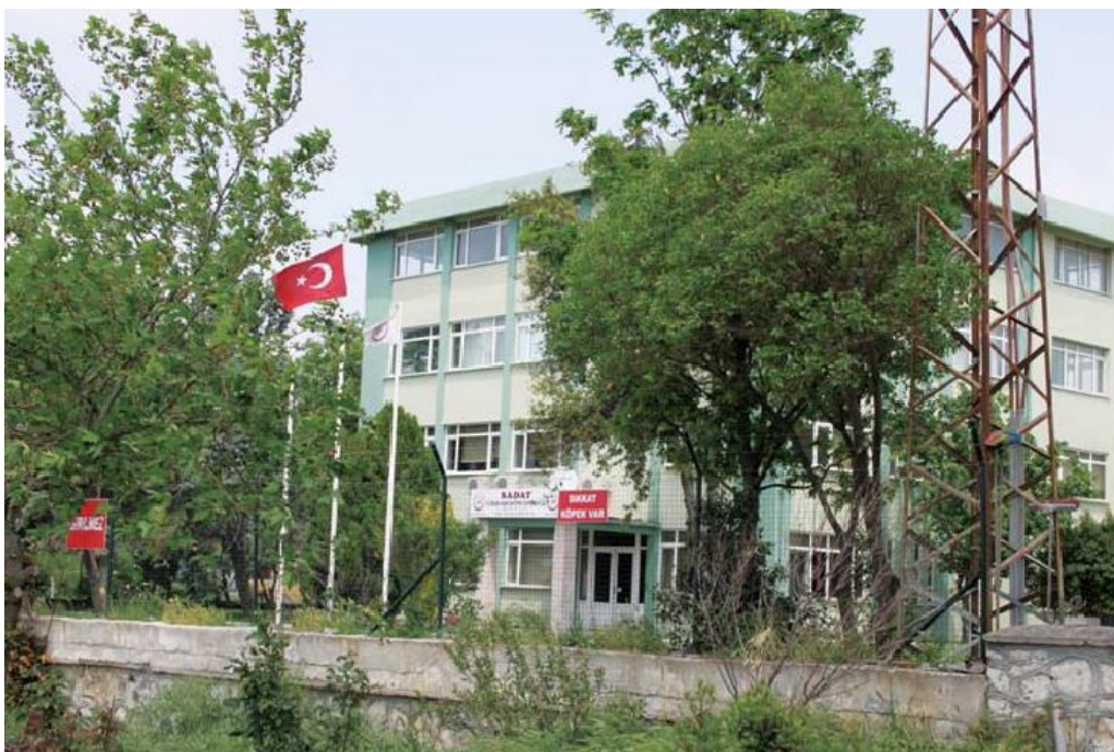
بارەگای سەرەکی کۆمپانیاکە

بەو شیوەیە کۆمپانیاکە خۆی پێشکەش دەکات و دەناسێنێت، بەلام ئەمە تەنها پروکاریکی یاسایی ئاشکرایە و لە ناوەڕۆکدا ئەوەی دەگوزەری شتێکی ترە، و ئەوەی کۆمپانیاکە لە ناوێشاندا بە "بەرگری" ناوی بردووە لە واقعدا؛ ئەو قەڵاچۆکردن و پاکسازییە کە دواى هەولێ کۆودەتاکەى سالی ۲۰۱۶ حوکومەتی ئەکەپە ئەنجامی دا دژی هەموو نەیارەکانی لەناوخوازی تورکیادا، و ئەو دەستتێوەردان و دەستپوێشتووییەى پێشکەشی تورکیایە لە ولاتانی ناوچەدا (سەیر ۲۰۲۰)، بە پشتگیری و بزواندنی گرووپە توندڕەوکان لە گۆرمپانی کێشمەکێشە خۆیانایەکانی ناوچەکە و بەتایبەتی ولاتانی عەرەبی و بەهەرە عەرەبیە قەیرانناویەکان و کێشمەکێشی فیلەستینی-ئیسراییلی و ئەو ناوچانەى ولاتانی دەورووبەری تورکیا و هەتاكوو باکووری ئەفریقا کە پێشکەشی تورکی چاوی لەسەریانە و پرۆژەى وەبەرھێنانی تێیاندا هەبێ و بە هاوکاریی پاشکۆکانی نیازی بەکەڵکەینانی دەرامەتە سروشتیەکانی هەبێ.