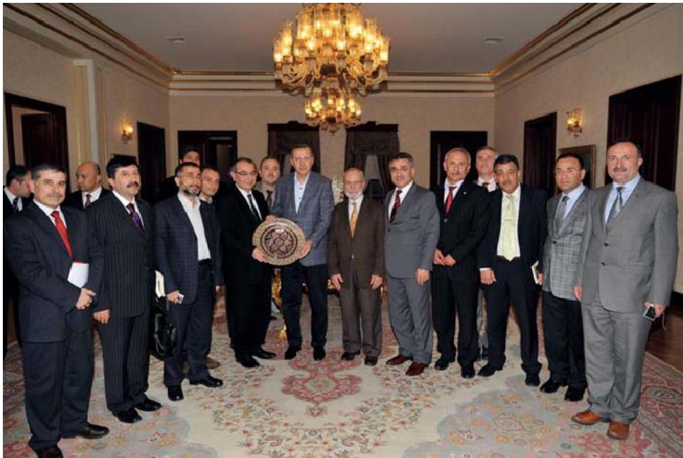
ئەردوغان، لە سەردان و بەخشىنى خەلاتىكىدا لە كاخى دۆلمەباغچە، بە يۈمەرىي ۋەفدىك كە لە تانرى قىردى و كەسانى تر پىنگدەھات. ۲۰۱۱/۲/۲۰

ئىتر بە بەرچاۋى ئازانسەكانى جىھانەۋە ئەندامانى چەكدارى كۆمپانىيائى سادات لە گەرمەي ھەۋلى كوودەتاكەدا ئامادە و چالاک و لە جوولەدا بوون لە گۆرەپانەكەدا (غانمى 2020)، و لە گەرمەي سەركەوتكردنى نەيارامى گومانلىكراۋ لە بەشدارىي ھەۋلى كوودەتاكەدا، ئەندامانى چەكدارى "گاردى شۆرش"ى ئەردوغان كە لە كۆمپانىيائى سادات و مىلىشياكانى ئەكەپە پىنگدەيت بە چاكەتى پۆلىسەۋە دەرەكەۋتن و پلەدار و ئەندامانى گومانلىكراۋى سوپايان دەستگىر دەكرد، بە چاكەتى پۆلىسەۋە بۇ ئەۋەي ۋەكوو پۆلىس دەرەكەۋن، بەلام ئەۋەي ئاشكراي دەكردن رىشيان بوو لە كاتىكىدا بەپىي ياسا كارمەند و ئەندامى ھىزمەكانى سوپا و پۆلىس بۇي نىە رىش دابنىت.