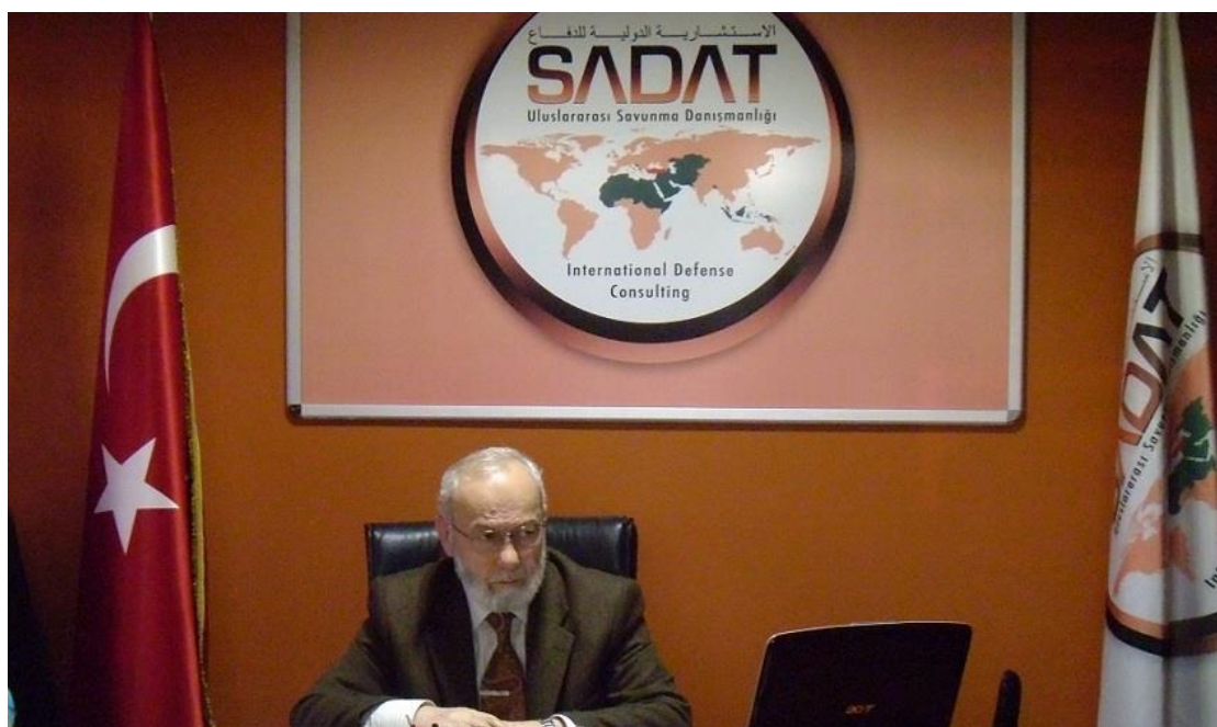
ئەمەنان تانرىقەردى، بەرپو مەملى سادات

دوابةدوای ھەملى كوودەتا لە تۈركىيە سالى ۲۰۱۶، ئەردوغان تانرىقەردى ۋەكو رايۇنكارى خۇي بۇ كاروبارى سوپاي تۈركىيە ديارى كەرد، ۋەكو مەملى، (ئەلى كامىل مەلىھ تانرىقەردى) Ali Kamil Melih Tanrıverdi (يان - بەكورتى - "مەلىھ تانرىقەردى" Melih Tanrıverdi)، بوو لىپىر سەراوى بەرپو مەردنى كۆمپانىيە سادات (كىو بوست 2018)، ۋە لە تۆيتەر بە شانازىيە نووسىيەتتى كە CEO سادات Defense. لە كاتىكدا، ۋەكو رايۇننامە نووسى تۈرك (چىدەم تۆكەر) باسى دەكات، تەنھا سى رۆژ دوای ھەملى كوودەتاكە، تانرىقەردى بە ياقوز ئوغھان Yavuz Oghan لە ئىزگە RS FM دەلەت: "ھىچ پەيوەندىيەكى ئۆرگانىمان لەگەل مەت ۋە دەولەت نە" "MIT ve devletle organik bağlantımız yok، كەچى ھەر دوای ماوھەكى كورت بەسەر ھەملى كوودەتادا لە كورسىيە رىزى پىشەمە ۋە دەلەتەكەدا دانىشت! (Toker 2016).