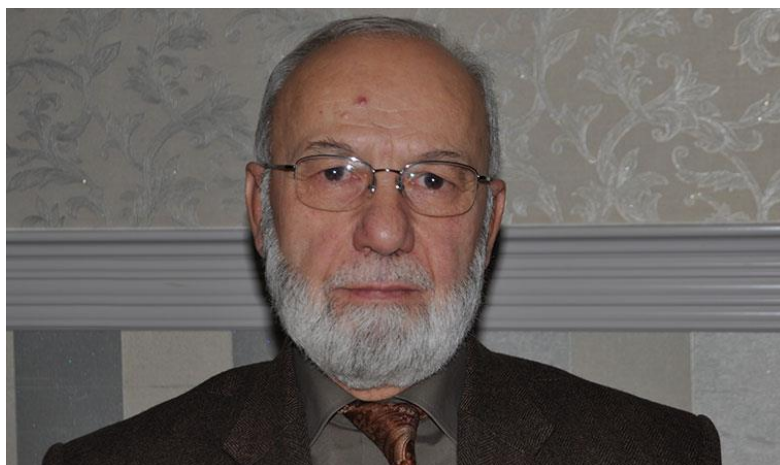
سەرتىپ "ئامىد" تۈركىي خانەشەين (ئەمەنان تانرىقەردى)

دوابةدوای ھەملى كوودەتا لە تۈركىيە سالى ۲۰۱۶، ئەردوغان تانرىقەردى ۋەكو رايۇنكارى خۇي بۇ كاروبارى سوپاي تۈركىيە ديارى كەرد، ۋەكو مەملى، (ئەلى كامىل مەلىھ تانرىقەردى) Ali Kamil Melih Tanrıverdi (يان - بەكورتى - "مەلىھ تانرىقەردى" Melih Tanrıverdi)، بوو لىپىر سەراوى بەرپو مەردنى كۆمپانىيە سادات (كىو بوست 2018)، ۋە لە تۆيتەر بە شانازىيە نووسىيەتتى كە CEO سادات Defense. لە كاتىكدا، ۋەكو رايۇننامە نووسى تۈرك (چىدەم تۆكەر) باسى دەكات، تەنھا سى رۆژ دوای ھەملى كوودەتاكە، تانرىقەردى بە ياقوز ئوغھان Yavuz Oghan لە ئىزگە RS FM دەلەت: "ھىچ پەيوەندىيەكى ئۆرگانىمان لەگەل مەت ۋە دەولەت نە" "MIT ve devletle organik bağlantımız yok، كەچى ھەر دوای ماوھەكى كورت بەسەر ھەملى كوودەتادا لە كورسىيە رىزى پىشەمە ۋە دەلەتەكەدا دانىشت! (Toker 2016).