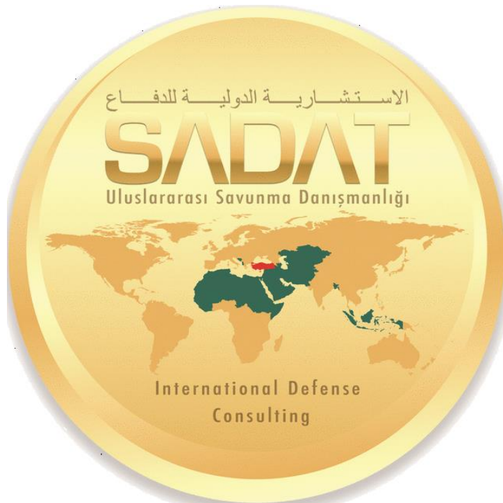
لوگو كۆمپانىي سادات

سنووردارى گىشتى "public limited company، و بە عەرەبى پىنى دەوترىت "كۆمپانىي پشكدارى گىشتى" ("شركة مساهمة عامة").