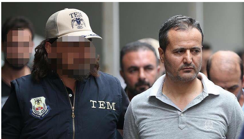
ھەندىك لەم وېنانەمى سالى ۲۰۱۶ بىلابوونەۋە، كە ئەندامانى چەكدارى "گاردى شۆرش"ى ئەردوغان پېشان دەدەن كە پەلەدارمەكانى سوپا دەستگىر دەكەن