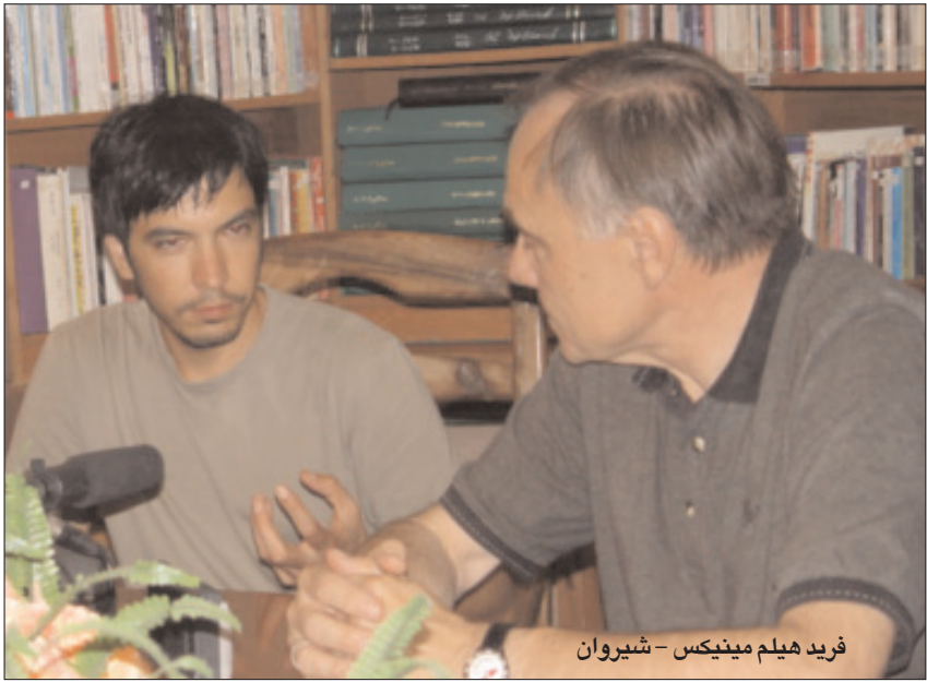
فرید هیلم مینیكس – شېروان

بەىزاۋتە كۇنەكانى دەست پىدەكاتۋ روۋەۋ پىكەۋەنسانە داھاتۋەكانىى بەرەۋام دەبىۋ سەرلپتىكدانكى زياتر لەكارەكانى بېكۇن نەخاتەۋە. (ھەلەكە لەۋ ساتەۋە دەست پى نەكات، كاتى ھونەرەندىك چۈارچئۋەۋ بۇيەى رۇن نەكرىت!) لىكدانەۋەيەكى ئازادانەى ئەم دېرەى سەرۋە لەزمانى ئەلمانىيەۋە، خۇ بەرەۋا بىيىنى يەكىك لەبال ھونەرىيە شئىۋەكارىيە چەسپاۋەكانى سليمانى لەچال نەنېت. كارەكانى ۋەك (كورسى چەۋرى) يان (چۇن كەسىك تابلۇكان بۇ كەروىشكىكى مروتوۋ شى نەكاتەۋە ۱۹۶۵) ۋ سەرچەم ئەۋ كارانەى كە لەمىژە سەر بەمىژۋوى ھونەرن، سەرسورمان نەخاتەۋەۋ بەم شئىۋەيش ۋرۇژندىنكى بەتۋانا دووبارە دەيىتەۋە، ۋەك لەخەفتاكانۋ ھەشتاكائى ھونەرى ئەۋروپىدا. پىكەۋەنانە فراۋانەكانى ۋەك (حەۋت ھەزار داربەرۋە،