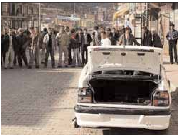
ئەو ئۆتۆبیلەکی جەماوێر ی شەمزیان تێرۆستەکانی سوپایان تێدا دەستگیر کرد

لەم کوێبەرەو پێدا ئامازە ی بەقەرەباغی میدیاکان کرد "با لەخۆرای چاری کەس ئانبار نەنگەین. ئاوەکو لێپرسێوھەکان کۆتاییان پێدێت. "ئەو پرسی رێکخستنی p.k.k. ی ھێتای گۆرێ گواپە نەبێو ئەم ھەلە وەقۆژیت "دەیانەوێت رواداوانی ئەم رابووبە بکەنە بۆ پێشمانە کردنی ھێزە ئەنجامیانان". بە ھاواتێانی کوردیشی گوت "ھاواتیەبە خۆشەوێستەکانمان دانیان