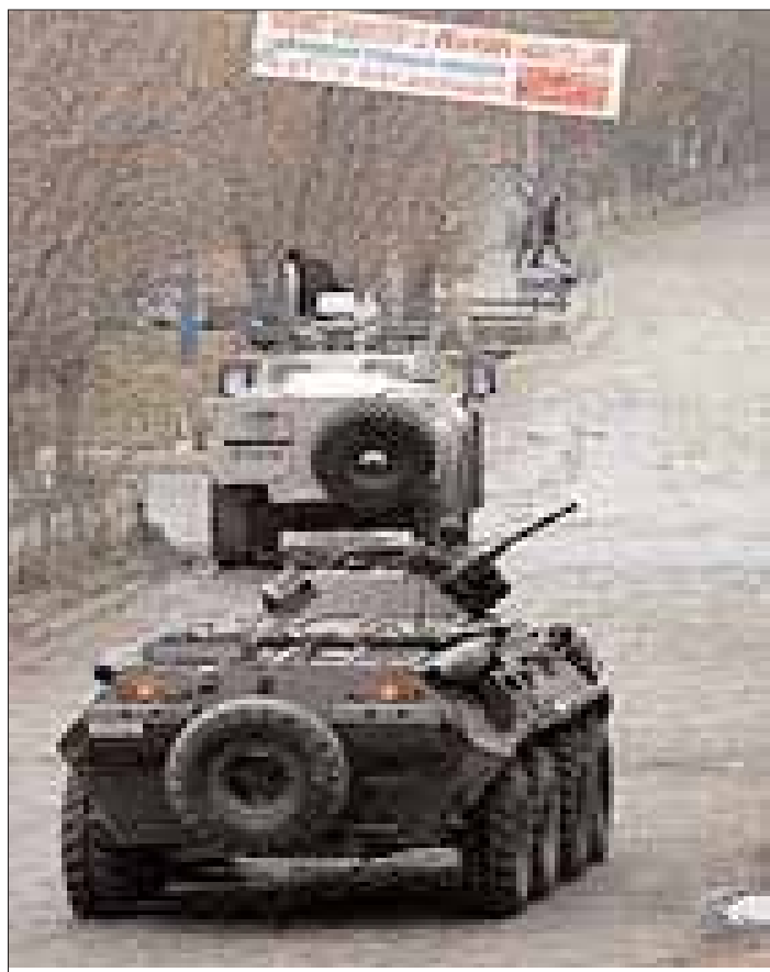
تاکەکانی سوپا توڤرک لە شەمزیان

ناشتنی تەرمەکاندا دا بخۆیاندا بگرن. ئەردوغان وتی ھەندیک لایەن ئەم رواداو دەکەنە بیاپاو بۆ ئەوێ تێکڕای ھێزە ئەنجامیان پێرەش یکن. دیکھاروی تێرۆر ئەمێنی ئەم ولاتە دەپارێزن. ئەردوغان دەپێت خەلک ئەم ھەلە وەرگیرێتو کەشوەھاویگە تەمۆزاوی بخولقێنێو بێم ئاڭدارا بگرەو دە کە لکانتی رێژوهرەسی جۆرە متمانە بەھێزە ئەنجامیان لاق