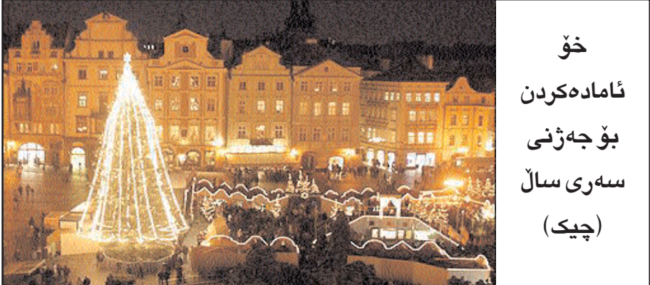
خۆ ئامادەكرىن بۆ جەژنى سەرى سالى (چىك)

لەم سەرى سالاڤا، راستە سالىكى تەمەن لەسەر سالاڤى رابوردوى ھەموو كەسىك (بى جياوازى) كەلەكە دەيى. بەشپەيەكى گشتىش، پىرۆزبايى لە ھەموو كەسىك دەكرى. (چاودىر) دەپويى ھاوكاتى پىرۆزبايى گشتى، پىرۆزبايى تايەتەش بۆ خەلكى تايەتەش بنىرى. لەوانە، پىرۆزبى لەوانەى شەوى سەرى سالى: - لەدايك دەبن و دايكو باوكو كەسوكارىيان دلخۆش دەكەن. - ژيانى ھاوسەرپىتى پىك دىتنو شەوى سەرى سالى، دەكەنە يەكەمىن شەوى مانگى ھەنگوینی ژيانيان. - سالاھايە باوكو دايكو ھاوسەرو خوشكو برايان نەديوو و ئەمشەوى سەرى سالى پىتيان شاد دەبنەو. - لەوژىنداڤانەى دلنيان رۆژى يەكەم، يان رۆژانى دواى سالى تازە، ئازاد دەكرين. - لەو كچو كورنەى شەوى سەرى سالى پەيمانى