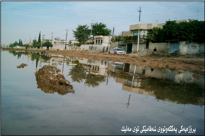
پرۆژەیهکی پەنگەوئووی شەقامێکی ئوی مه‌لیك

ئەوێ زیاتر توشی گرفت ھاتوو بەدەست ئەم کارەو خۆیندکاران و مامۆستایانی ھەردو خۆیندنگان کە بەوێپێ بێژاریەو سکاڵای خۆیان دەرەدەبێن سەبارەت بەدواخسترو سستی کارکردن لەم پڕۆژە یەدا.